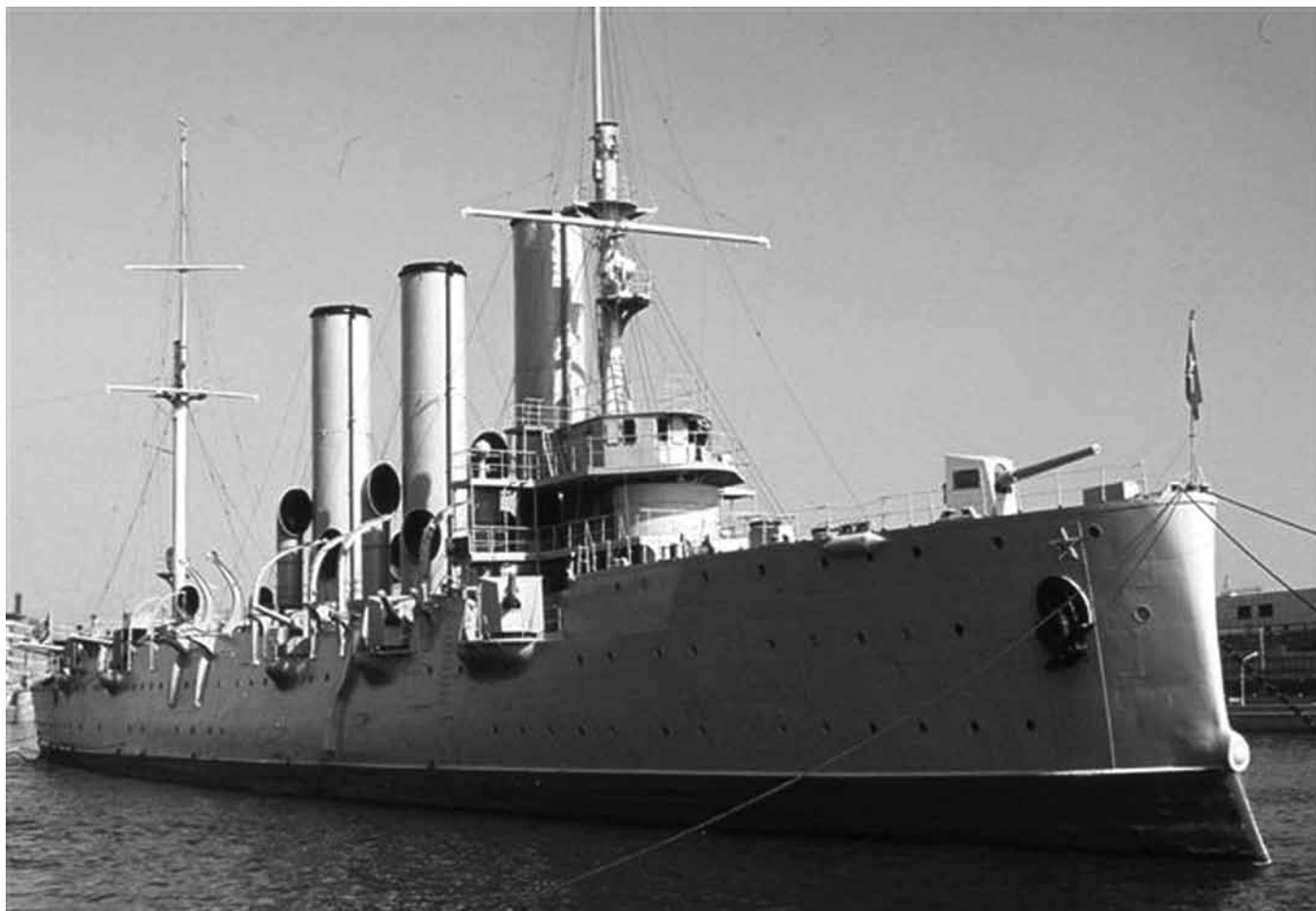
”Aurora” i Leningrad under 1970-talet

Under tolv dagar i september 2017 ska en jättelik militärövning hållas i Sverige, den största sedan kalla kriget. 19 000 man från den svenska försvarsmakten och flera Nato-länder, däribland USA, ska träna ”försvaret” mot ett förestäld ryskt anfall på land, till havs och i luften. Övningen heter ”Aurora 17”. En övning för krig och kapitalism.