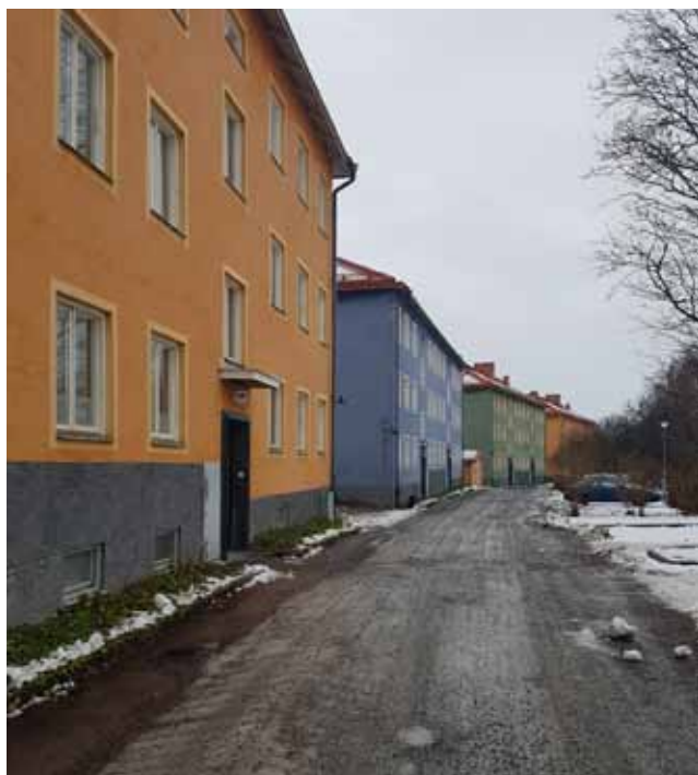
Folkhemmet och färgerna. De vackra husen i Lasseby Gärde i Uppsala lyser även en gråmulen dag

En infart till Salabacke-området. Det syns kanske inte på bilden, men här har man skapat en liten öppen plats invid den stora gata som ramar in kvarteret, med flera små vägar som mynnar ut. Det betyder att den lilla platsen blir en naturlig mötespunkt, och attraktiv för placering av butiker. Det är en tribut till Folkhemmets arkitekter att det så uppenbart fungerar än idag – i det här kvarteret hittade jag tre sådana platser som fortfarande är i bruk på det sätt som en gång avsågs.