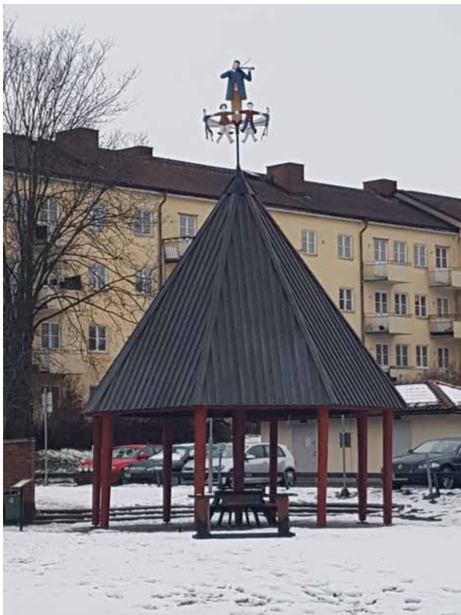
Ett väderskydd med konst för folket som vindflöjel...Såna här skydd skulle möjliggöra hälsosam vistelse utomhus för både vuxna och barn, och finns bevarade i större utsträckning än man kan tro.

Det här byggandet kunde ju ha artat sig på lite olika sätt, och gjorde det också, men det fanns ändå ett stort inspirations- och idéarv som påverkade Folkhemmets stadsplanerare och arkitekter. Man kan börja med vad som kallas för modernismen och som innefattar en rad olika stilar som utvecklades på 20-talet och blev den viktigaste övergripande arkitekturströmningen efter andra världskriget. Vad de olika modernistiska stilarna har gemensamt är en ny industriell byggnadsteknik med glas, stål och armerad betong, något som ofta kombinerades med en betoning på ljus, luft och utrymme, och att man rent estetiskt inte längre tittar bakåt mot antiken och medeltiden – inga klassiska tempelfasader och gotiska fönster här inte. Nästan alla känner till Le Corbusier, en av modernismens absoluta förgrundsförare som utvecklade sin egen stil, funktionalismen, med rena avskalade byggnader. Här hittar vi också en man som mer direkt kan ses som en kollega till de svenska folkhemsarkitekterna: Bruno Taut, en tysk socialistisk arkitekt. Efter att ha varit verksam i Berlin under Weimarrepubliken flydde han från nazisterna och arbetade i Sovjet, men fick ge sig av 1933 när hans sätt att tänka inte längre föll i god jord. Han använde sig av en mjukare funktionalism med fler dekorativa element och en mer mänsklig mått-skala, han arbetade mycket med färg och var inspirerad av något som kallas för trädgårdsstaden, som jag strax ska komma till. Folkhemsarkitekturen med