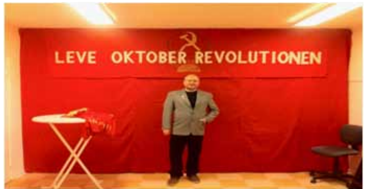
TEXT OCH BILD/ LJUBOMIRT DEVIC