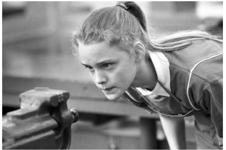
En elev får polyteknisk undervisning på VEB Robotron i Karl-Marx-Stadt. Den polytekniska utbildningen förlades ofta till arbetsplatserna.

Den polytekniska undervisningens utformning skiljde sig åt mellan stad och land och var beroende av den industri som fanns i närheten. Konkret kunde det ta sig uttryck i att eleverna på landet hjälpte till i skörden och i staden kopplades klasser ihop med olika industrier och arbetsplatser. Sammanlagt deltog över 5 000 företag från industrin, byggnadsindustrin, samt jord- och skogsbruket i det polytekniska systemet. En viktig beståndsdel i det polytekniska systemet var faderskapet mellan eleverna och arbetarna. Målet med faderskapet var skapandet av större möjligheter för arbetarklassen att utöva direkt inflytande på utbildnings- och uppfostrande-processen. När allt fungerande bra var fadderskapsbrigaderna (arbetarna var organiserade i arbetsbrigader) en hjälp för