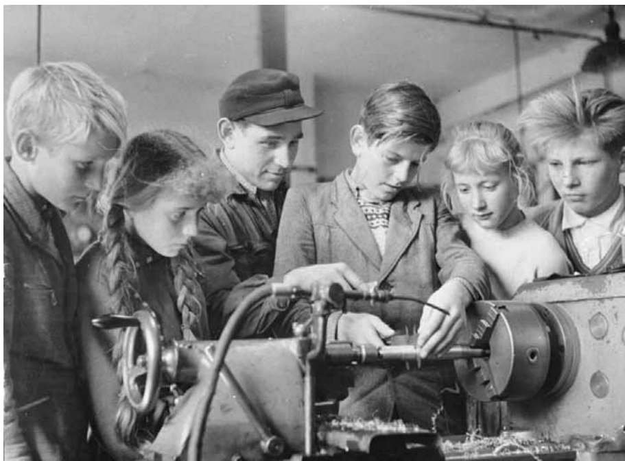
En arbetare visar en grupp elever hur man reparerar en gödselspridare på en verkstad för traktorer.

När man först byggde upp skolan var det inte helt klart hur dess struktur skulle se ut. Det fanns egentligen två grupper pedagoger, som föreslog olika inriktningar som undervisningssystemet kunde ta. Det program som slutligen antogs för skolan i östra Tyskland var en kompromiss mellan dessa två grupper. Den första gruppen pedagoger ville skapa en distans mellan staten och skolan, så att staten inte skulle kunna få rollen som uppfostrare