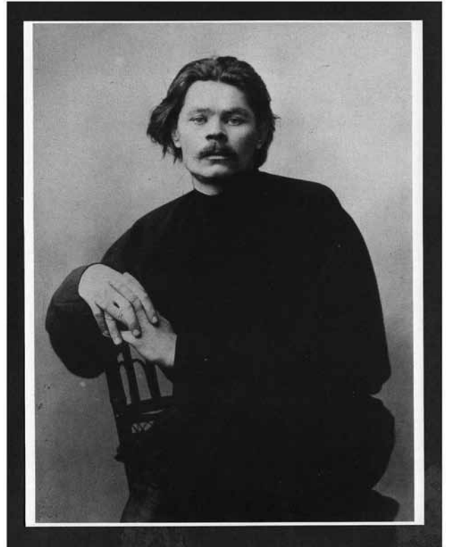
Maxim Gorkij – privatlärare författare och medlem av den bildade allmänheten

formell skolutbildning, och här hittar vi också en hel del av våra egna arbetarförfattare som t.ex. Moa Martinsson och Ivar Lo-Johansson, och en rad konstnärer.