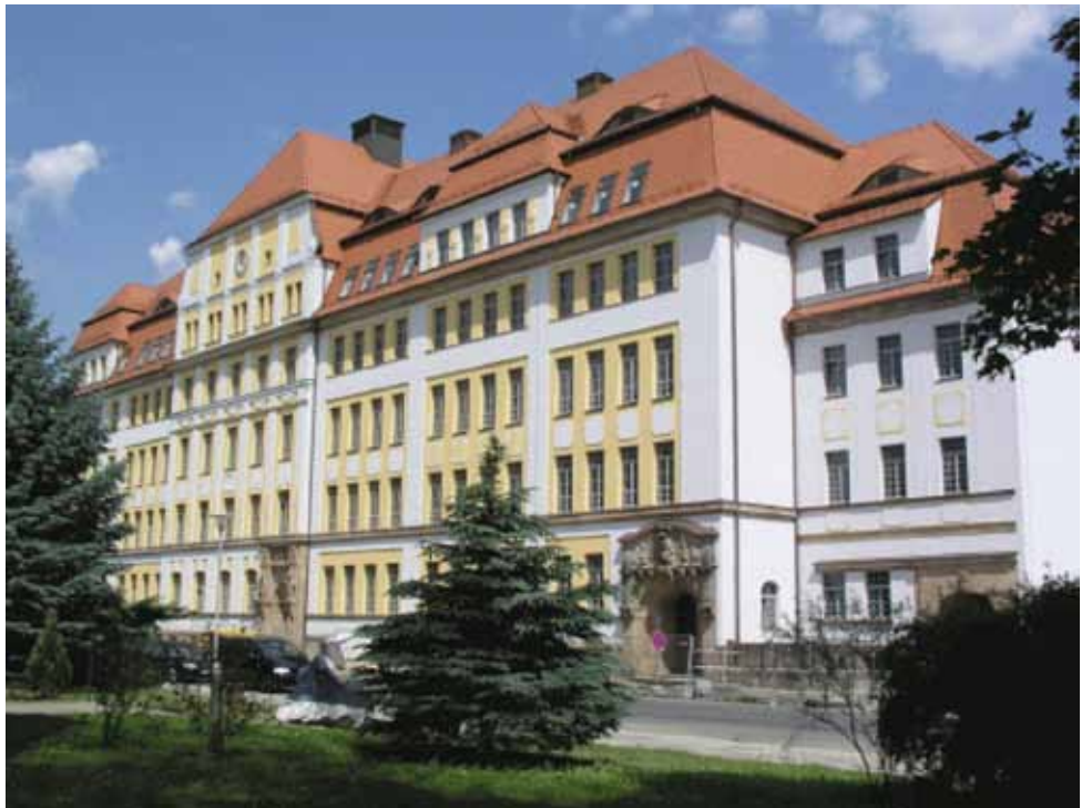
Martin-Andersen-Nexö gymnasium Dresden

Övergången från grundskolan till gymnasiet blev en ny skärningspunkt när borgerliga bildningsprivilegier skulle ersättas med lika rättigheter för barn från arbetar- eller bondefamiljer. Lärarna och skolledningarna fick i uppdrag att föreslå elever med sådan bakgrund